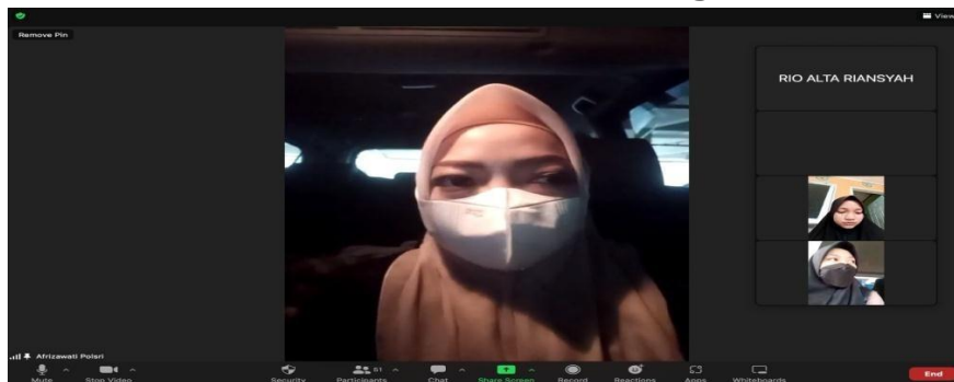
Gambar 6 Dokumentasi Kegiatan