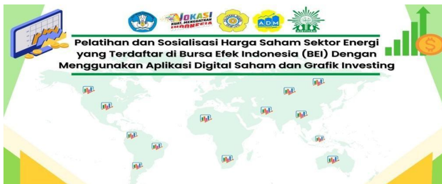
Gambar 4 Background Pengabdian

Gambar diatas memperlihatkan grafik harga fluktuasi saham sektor energi. Saat ini jangkauan implementasi sosialisasi pasar sudah sering di selaraskan dengan kegiatan masyarakat, edukasi-edukasi yang dilakukan oleh pasar modal dengan melakukan webinar secara online telah sering dilakukan, terlebih lagi yang memiliki akun media sosial pihak BEI sering memberikan edukasi dengan live streaming di instagram maupun youtube.