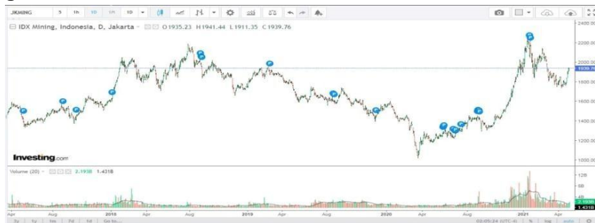
Gambar 1 Fluktuasi harga saham pada investing

Untuk mengetahui perubahan harga-harga saham komoditas energi, bisa dilihat pada aplikasi saham pada masing-masing sekuritas, dimana setiap sekuritas meimilki fitur-fitur yang berfungsi untuk memudahkan para nasabah mereka mengakses data-data saham yang seringmenjadi tolak ukur dalam keputusan pembelian saham. Aplikasi yang digunakan para sekuritas berupa MOST untuk sekuritas mandiri, IPOT untuk sekuritas Indo Premier, VOLT untuk sekuritas Valbury, dan masing banyak lagi. Namun ada cara lain untuk melihat perubahan harga-harga saham khususnya sektor energi yaitu dengan melihat grafik di investing.com.