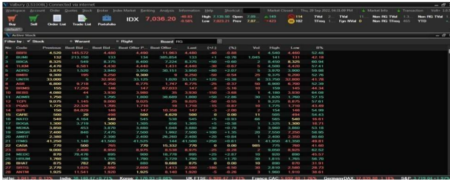
Gambar 2 Harga saham pada aplikasi volt+

Gambar diatas merupakan daftar harga saham sektor energi yang ada pada aplikasi saham Volt+